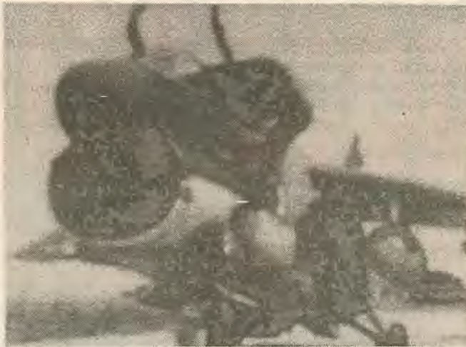
Ελληνικό Φάντομ ΣΙΑ

— Η Τουρκία συντηρεί την κατοχή στην Κύπρο καταπιέζει τις μειονότητες, διεκδικεί διέξοδο στο Αιγαίο. Αφτα για τον ένα. Η ψυχροπολεμική στρατηγική των Αμερικάνων όμως συμπίπτει αυτή την φορά με τις «εθνικές ανάγκες» του ελληνικού κεφαλαίου για στρατιωτικοποίηση της Λήμνου και ένταξη της στον αμυντικό σχεδιασμό του ΝΑΤΟ για δημιουργία δεξιάς ζώνης άμυνας στο Αιγαίο μετά την θάλασσα του Μαρμαρα. Ακόμα. Μπορεί η στρατιωτικοποίηση των νησιών να παραβιάζει τη συμφωνία της Λωζάνης. Όμως οι Αμερικάνοι στρατηγοί γελούν ειρωνικά με το αίτημα της Τουρκίας για αποπλιση των νησιών σε μια εποχή πυρηνική που στηρίζεται στη κλιμάκωση των εξοπλισμών και όχι στη μείωση τους.